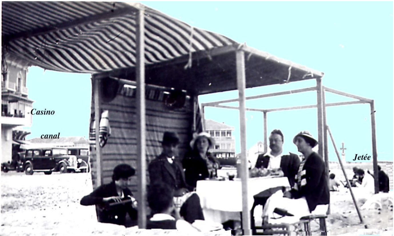
PALAVAS rive droite 1934