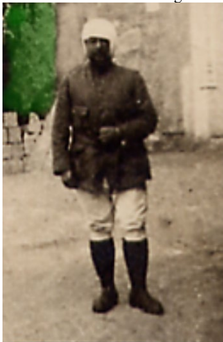
Blessé et barbu à Toul