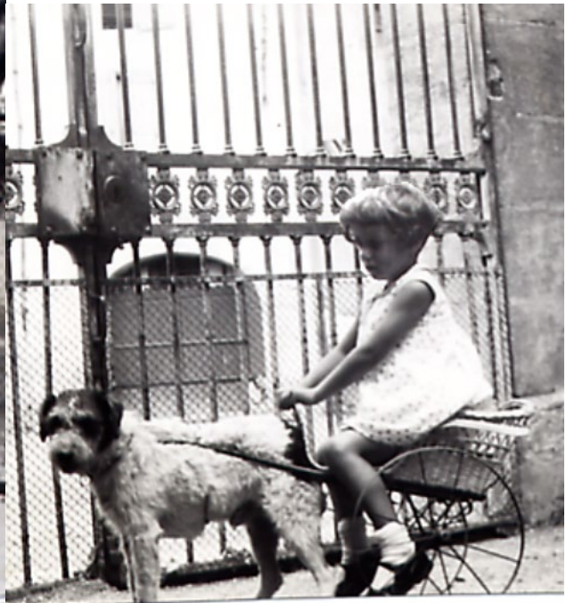
Aline vers 1933