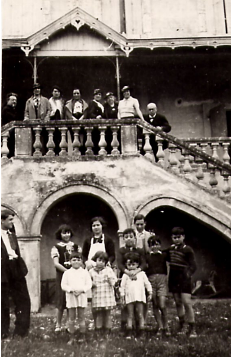
A LAROQUE l'échelle des générations