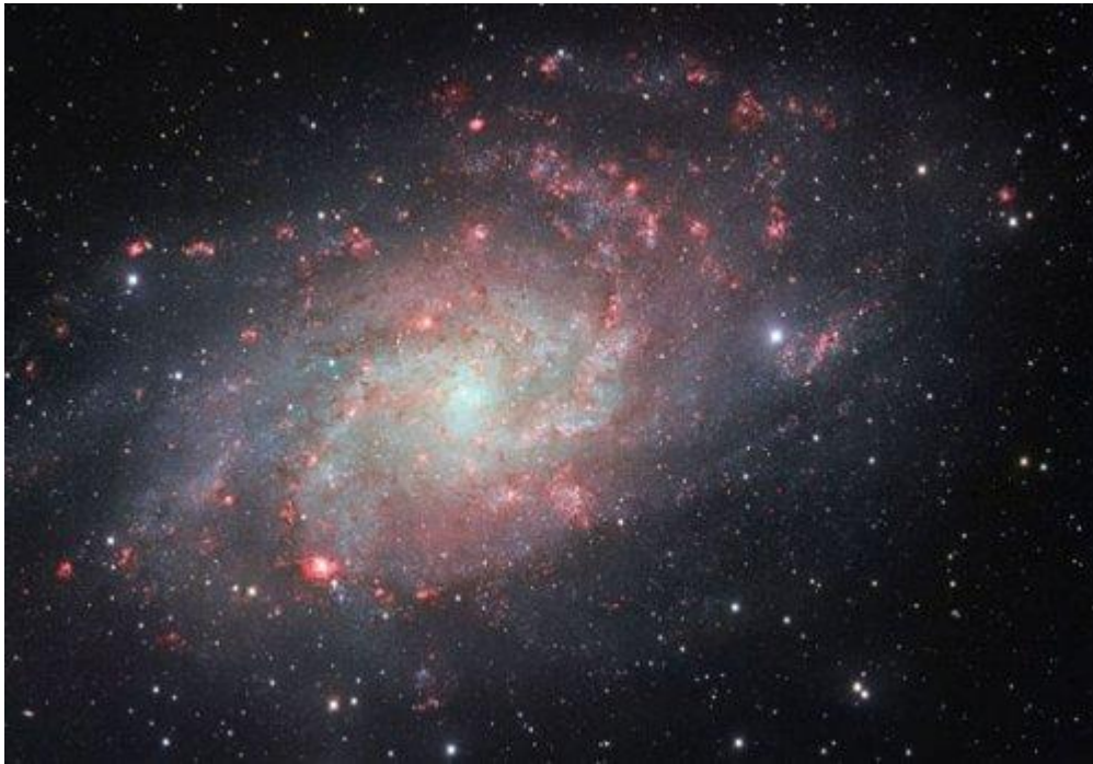
Image de la galaxie Messier 33 obtenue en août 2014 au VLT de l'ESO.

Dans un article publié en juillet 2014 dans la revue Monthly Notices of the Royal Astronomical Society , des scientifiques de l'Observatoire de Paris, de l'université Pierre et Marie Curie et de l'INAF-SISSA de Trieste (Italie), s'attachent à décrire les principales propriétés observées dans les galaxies à l'aide d'une nouvelle théorie où interviennent matière noire et gravité.